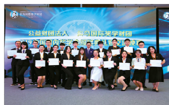
各大学代表認定証書授与