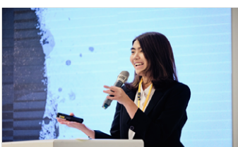
奨学生よりスピーチ