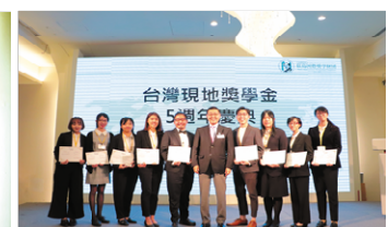
各大学代表認定証書授与