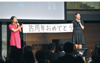
奨学生よりダンス&歌披露