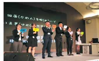
奨学生より歌披露