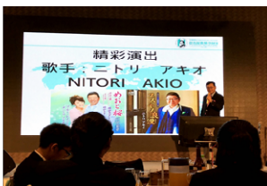
代表理事より歌披露