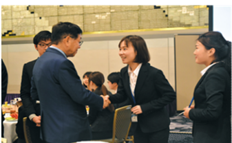
代表理事奨学生一人一人と挨拶