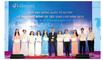
各大学代表認定証書授与