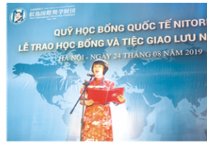
大学先生代表祝辞