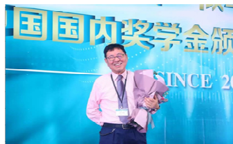
代表理事への感謝:花贈呈