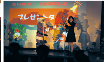
クイズ大会:プレゼントタイム