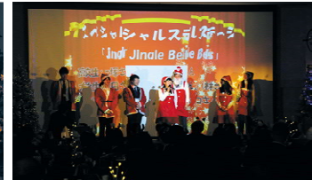
OBOG・奨学生とのダンス披露