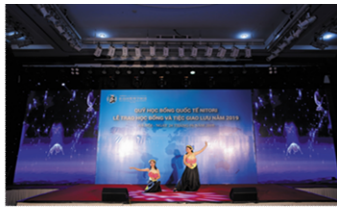
奨学生ベトナム伝統舞踊披露