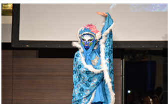
OBOGより中国国粹「变面」披露