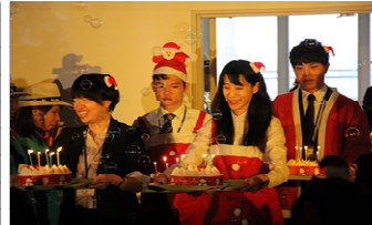
奨学生へのクリスマスケーキ