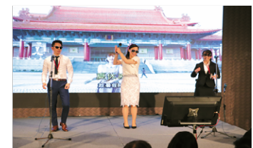
OBOGよりダンス&歌披露