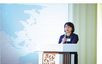
大学先生代表祝辞