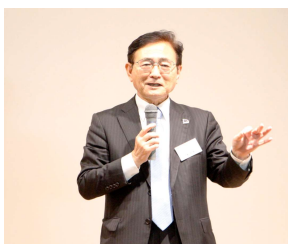
京都大学総長講話