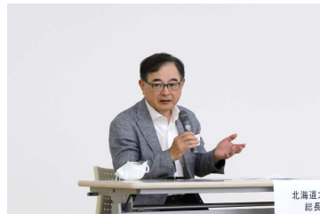
北海道大学総長質問会