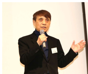
ご来賓講話(安藤忠雄様)