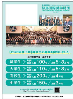
・募集要項付きリーフレット(下期)